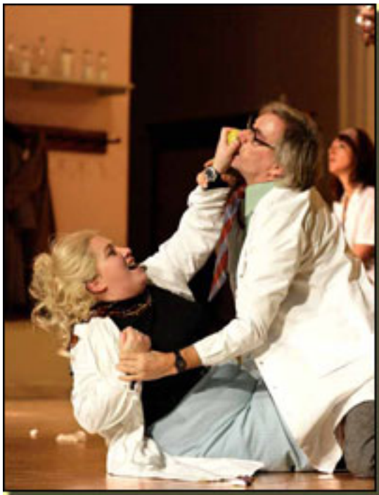
La historia de la empuñadura Marthaler