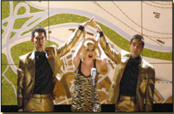
DAVID ECHEVARRÍA SELVA BARÓN/ANDONI ARCILLA

La obra no cumplió las expectativas de Bernstein . Se representó pocas veces y discográficamente tuvo escaso interés.