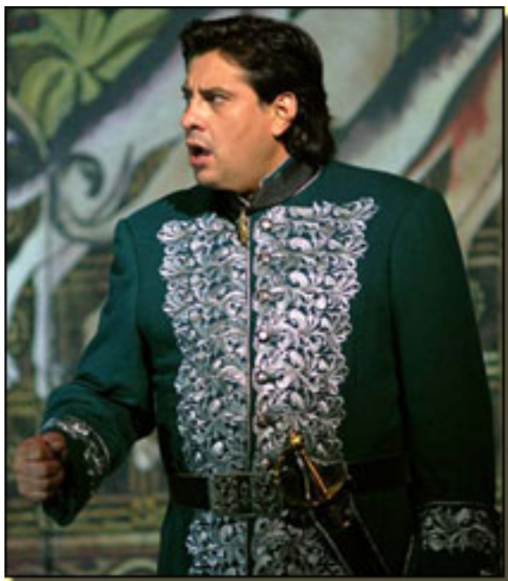
MARCELO ÁLVAREZ

Esta nueva dimensión vocal le permite estrenar próximamente en el Covent Garden Un ballo in maschera