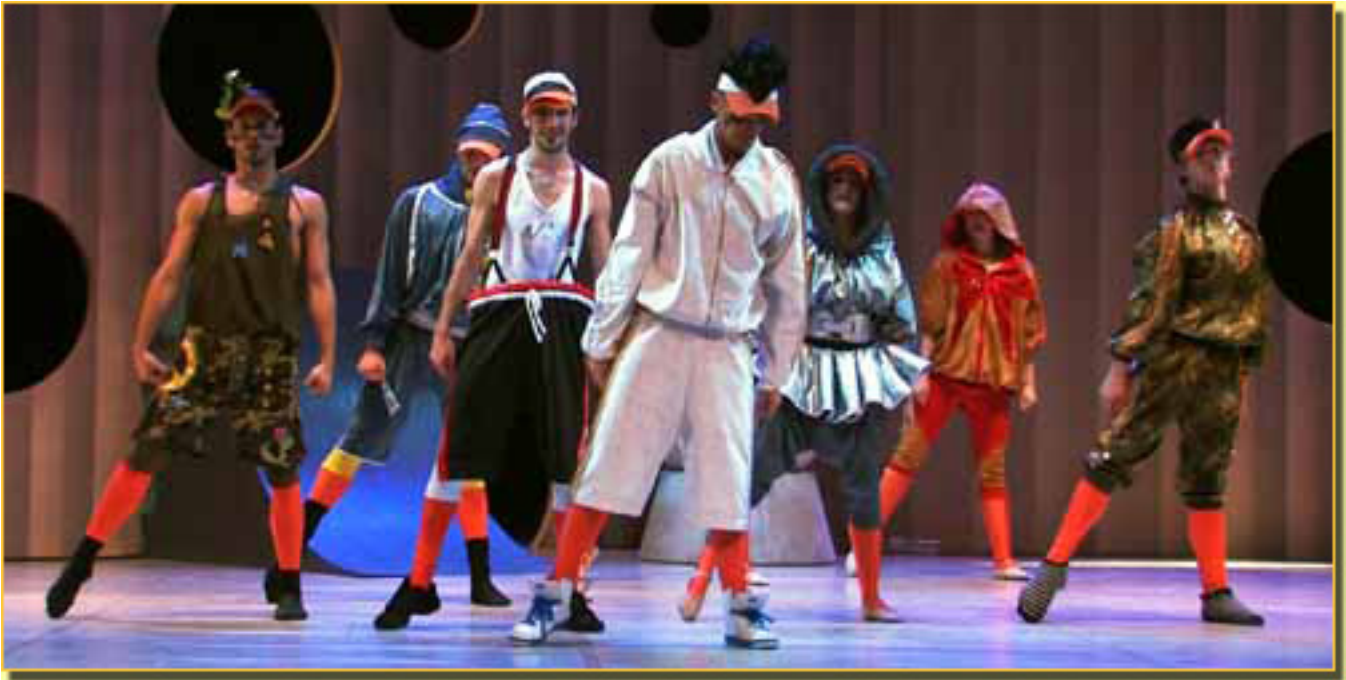
EL PATITO FEO

Sábado, 20 de Marzo de 2010 17:53 - Actualizado Jueves, 13 de Mayo de 2010 12:04