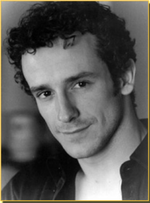
VÍCTOR ULLATE ROCHE

Sábado, 20 de Marzo de 2010 17:53 - Actualizado Jueves, 13 de Mayo de 2010 12:04