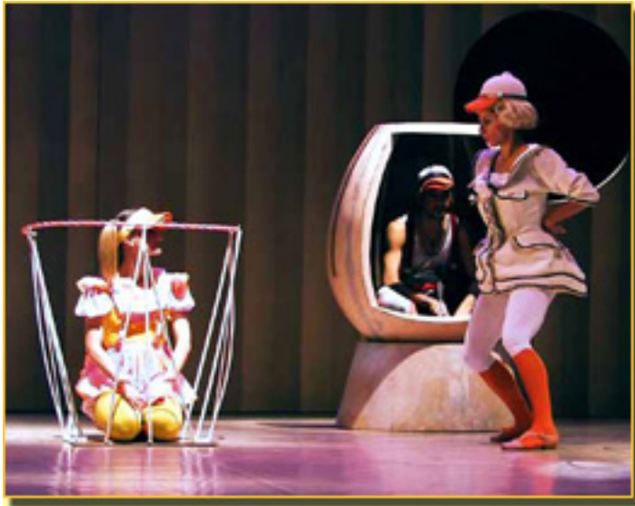
EL PATITO FEO

Domingo, 14 de Marzo de 2010 18:51 - Actualizado Jueves, 13 de Mayo de 2010 12:01