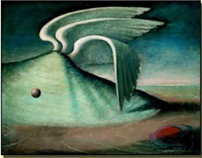
PINTURA de EDGARD ENDE Michael Ende