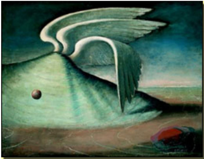
PINTURA de EDGARD ENDE Michael Ende estudió en la

Jueves, 25 de Marzo de 2010 14:44 - Actualizado Jueves, 13 de Mayo de 2010 11:43