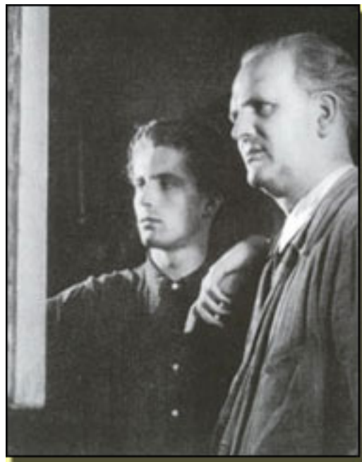
MICHAEL Y EDGAR ENDE

Se han encontrado similitudes entre las pinturas de Edgar y las imágenes que sugiere Michael en sus