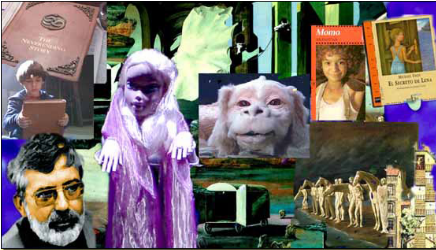
MICHAEL ENDE Y SU MUNDO

Jueves, 25 de Marzo de 2010 14:44 - Actualizado Jueves, 13 de Mayo de 2010 11:43