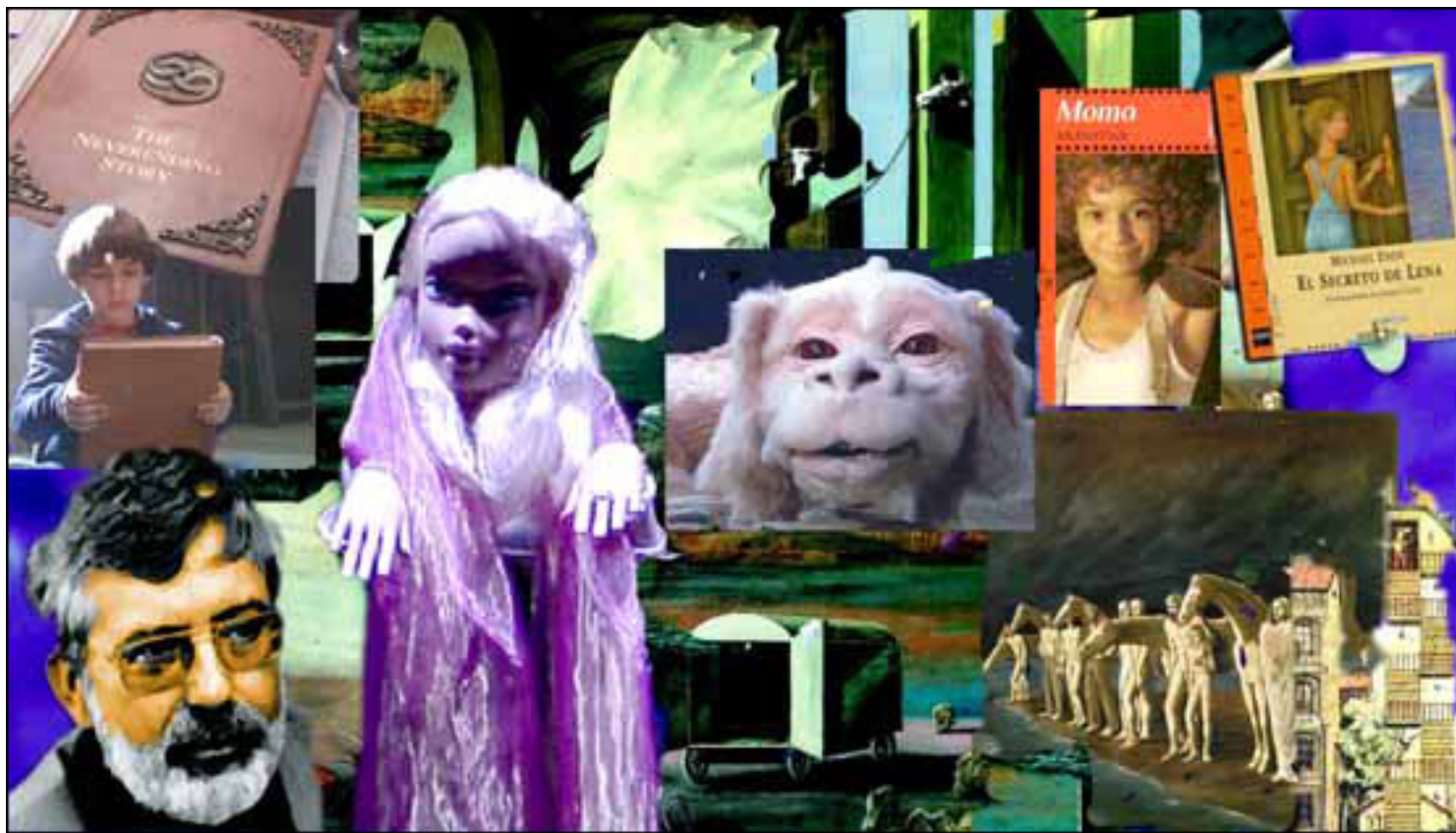
MICHAEL ENDE Y SU MUNDO

Jueves, 25 de Marzo de 2010 14:44 - Actualizado Jueves, 13 de Mayo de 2010 11:43