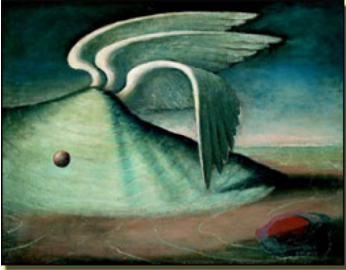
PINTURA de EDGARD ENDE Michael Ende estudió en la

Escrito por www.madridteatro.net Jueves, 13 de Mayo de 2010 11:34 -